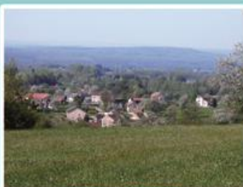
Vue sur la Ramouse