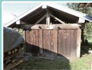
Au Prémourey centre, le Chalot de 1681