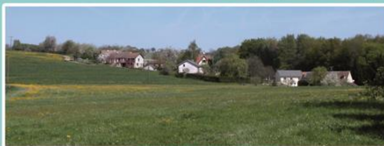
Au Bout, « Chez Le Bourguignon »

Le nom du « Bout » (ancien nom : « le Boulst ») viendrait de sa situation en partie extrême de la demeure seigneuriale de Fougerolles-le-Château.