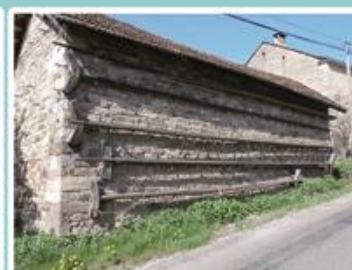
Des « pieds-de-Chèvre » au Prémourey