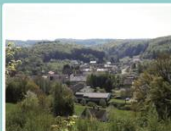
Vue sur Fougerolles-le-Château