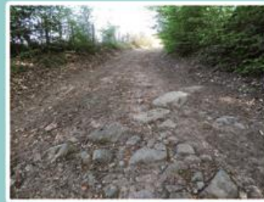
L'ancienne route médiévale de Fougerolles-le-Château à Plombières, à l'approche du Prémourey