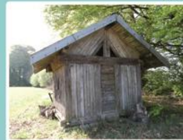
Un Chalot entre le Prémourey et Beaumont, déplacé en pleine nature...