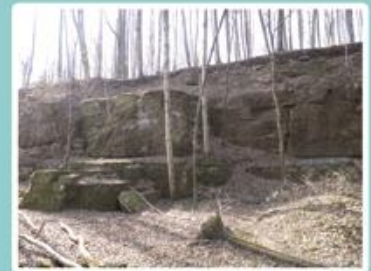
Les carrières de grès du Bout

Plusieurs lieux rassemblaient les habitants du Prémourey. C'est le cas des « Grand' Fontaines » pour leur source d'eau pure destinée à la boisson des habitants et celle des animaux, ainsi qu'au lavage du linge.