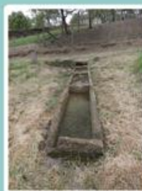
Les « Grand' Fontaines » du Prémourey