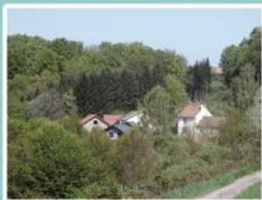
« Chez Jean Dicotet »