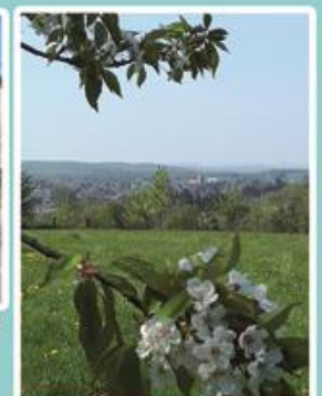
« Un chéqueillot » au Bout. Au loin, Fougerolles.