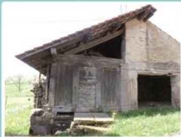
Le Chalot de Chez Jean Dicotet, 1790