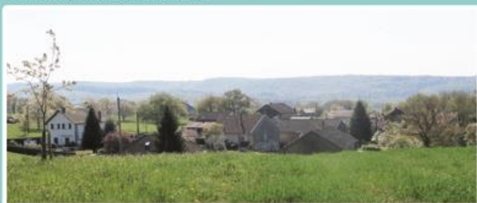
Vue sur le centre du Prémourey

Le « Prémourey » désignerait un lieu rempli de prairies mais aussi tirerait son nom de celui d'un ancien propriétaire (Mourey ?). La section fut traversée par l'ancienne route médiévale allant de Fougerolles-le-Château à Plombières-les-Bains où quelques pavés carrossables sont encore visibles ... La section est traversée de nos jours par la route départementale 307.